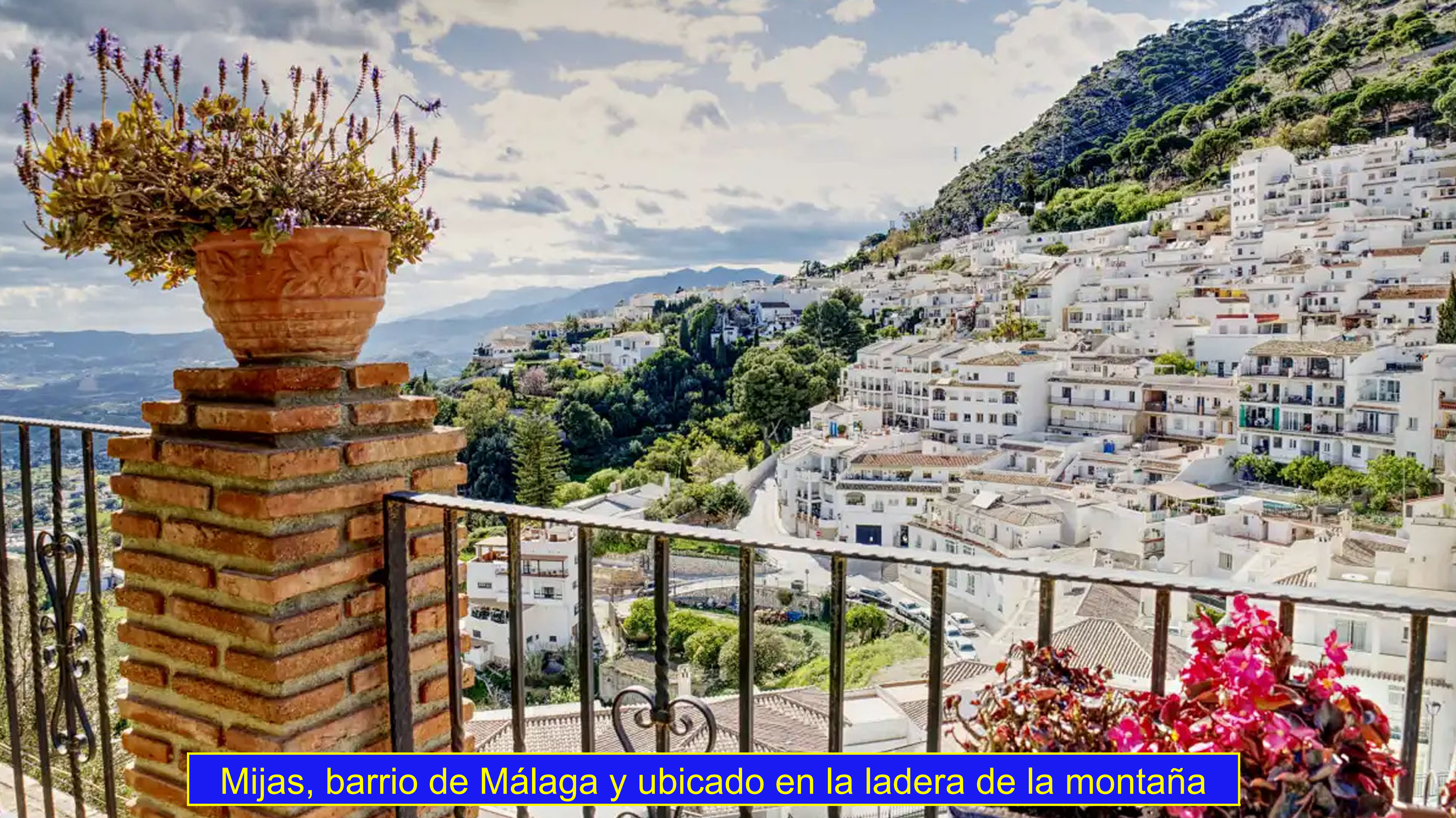
Mijas, barrio de Málaga y ubicado en la ladera de la montaña