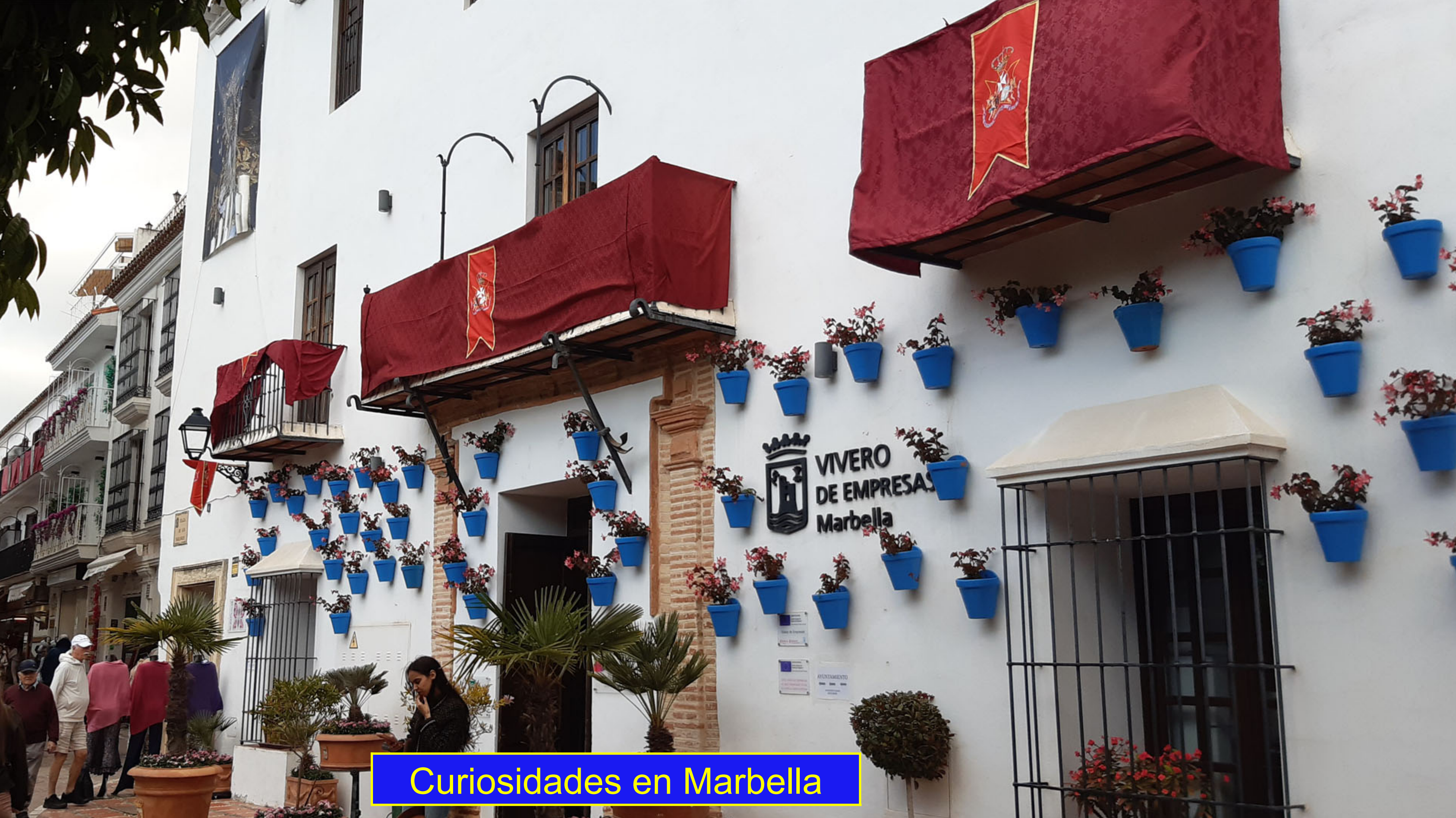
Curiosidades en Marbella