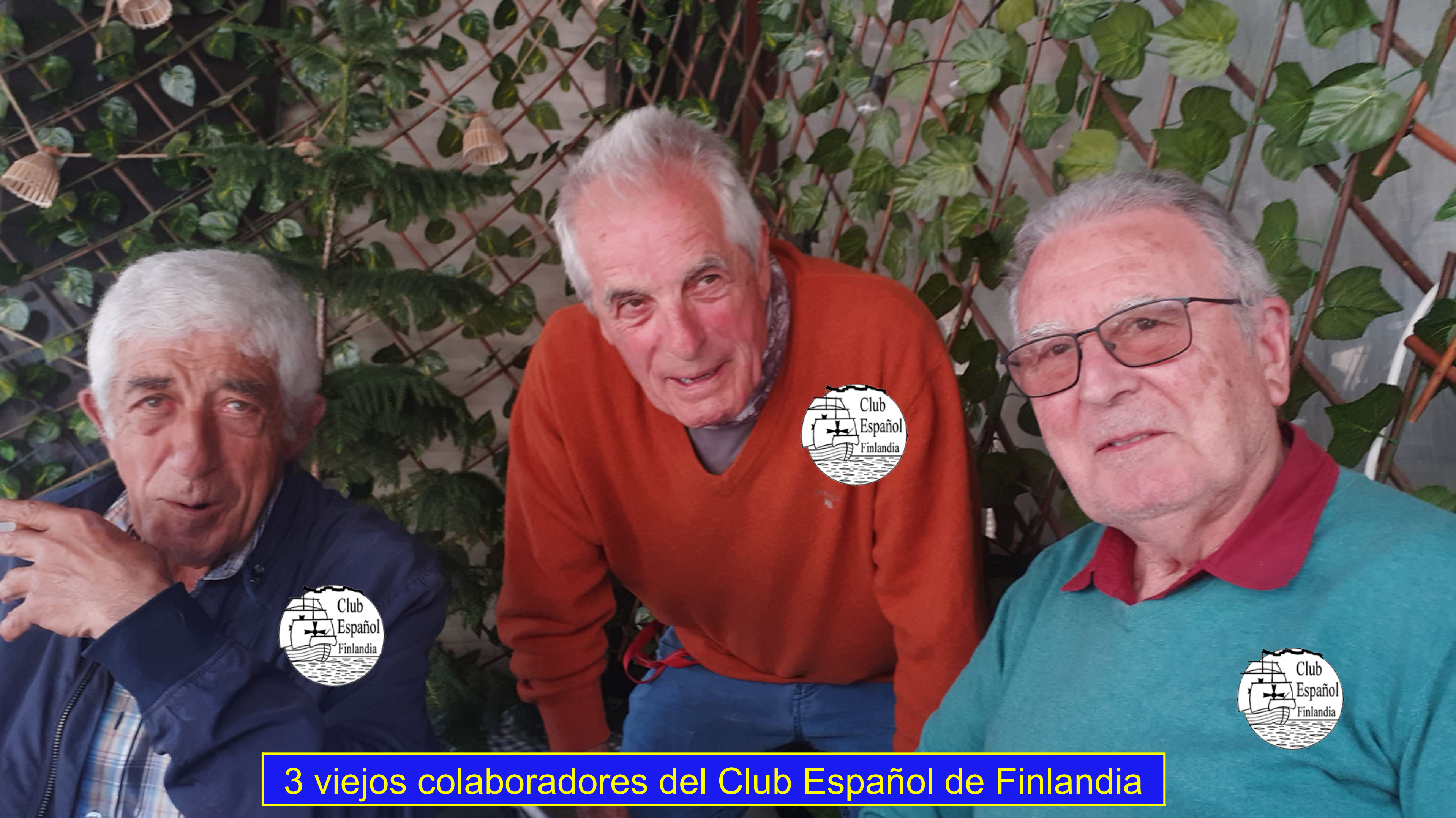
3 viejos colaboradores del Club Español de Finlandia