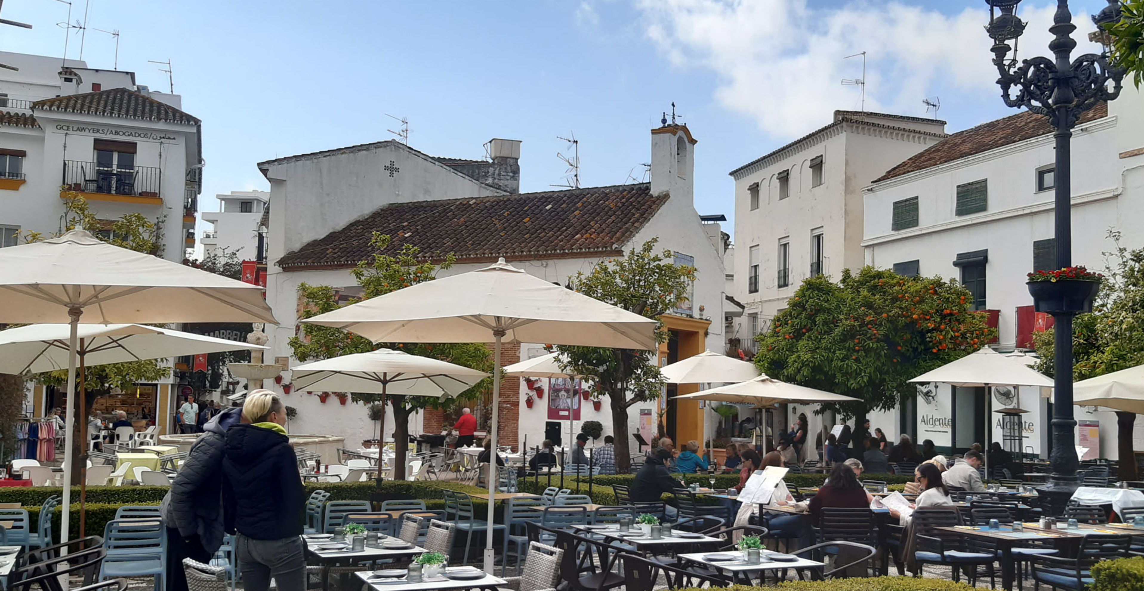
Iglesia y Ayuntamiento en Marbella