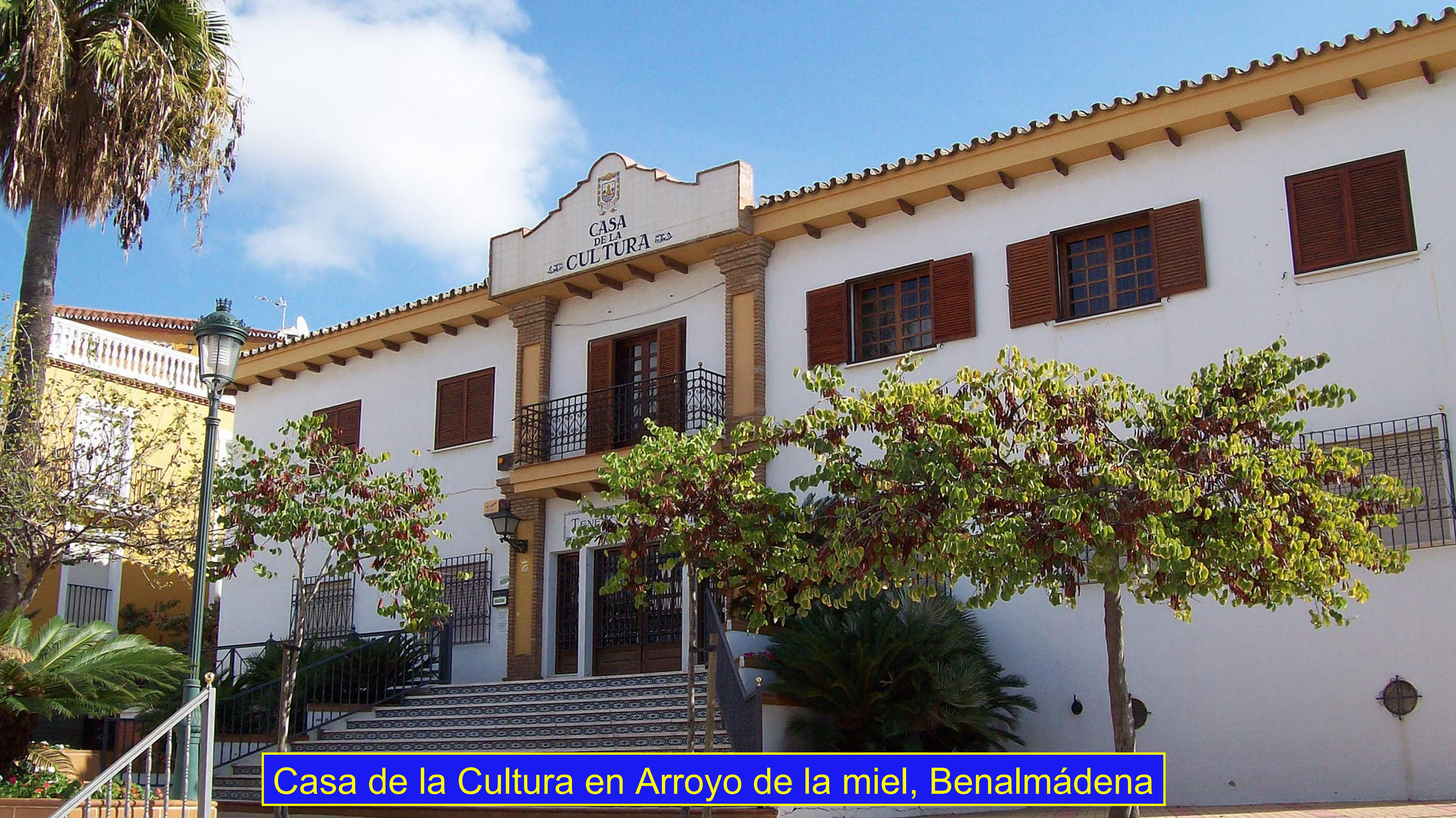
Casa de la Cultura en Arroyo de la miel, Benalmádena