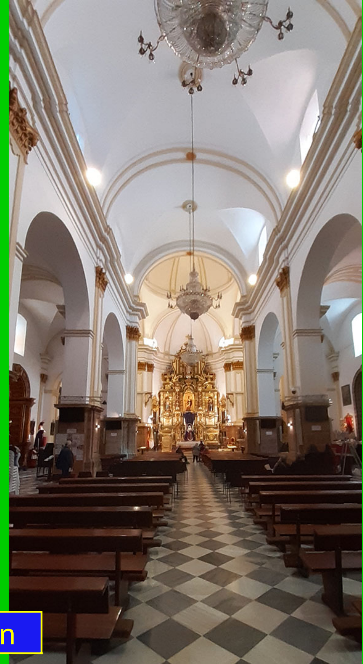
Nuestra señora de la Encarnación