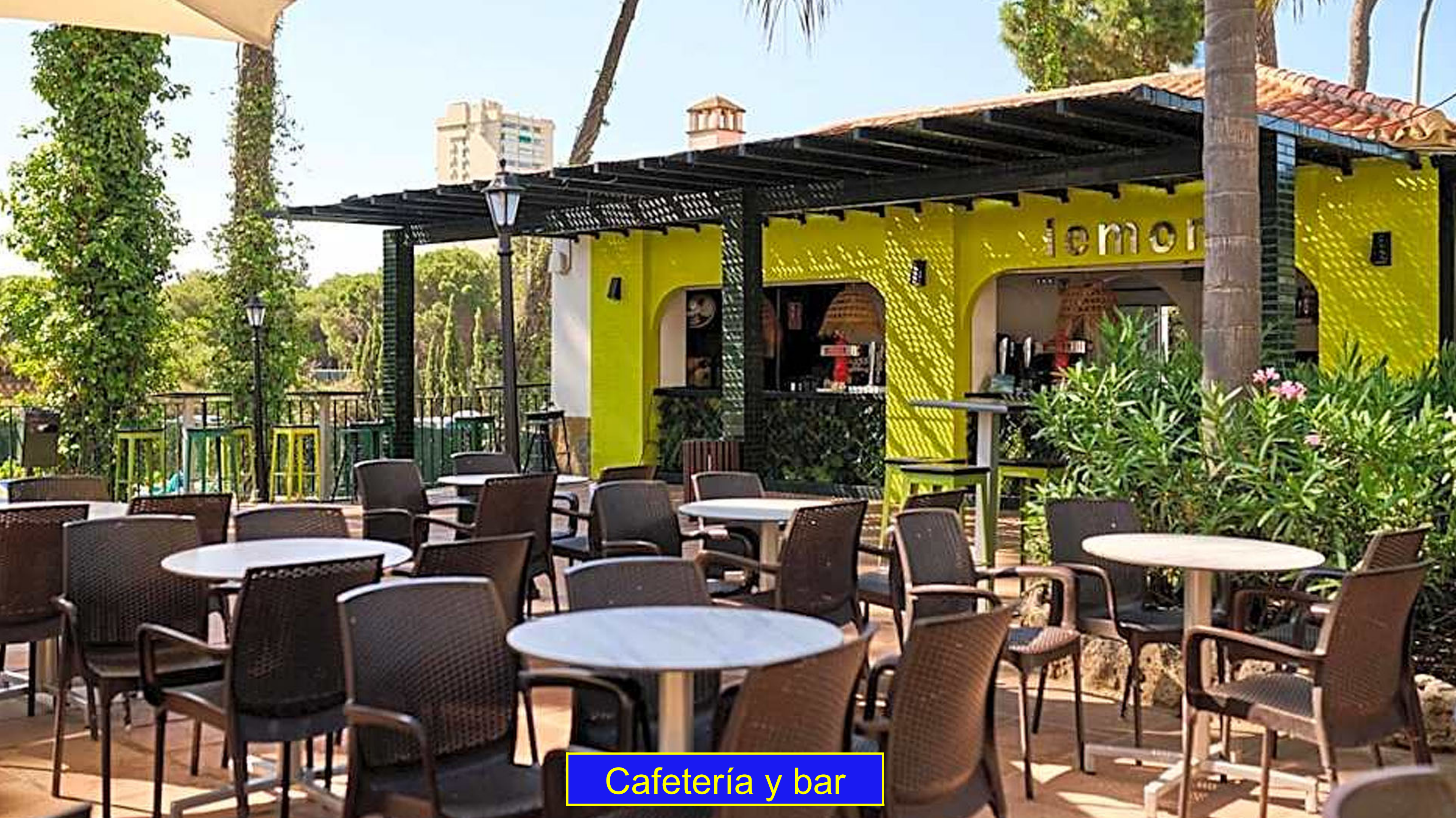
Cafetería y bar