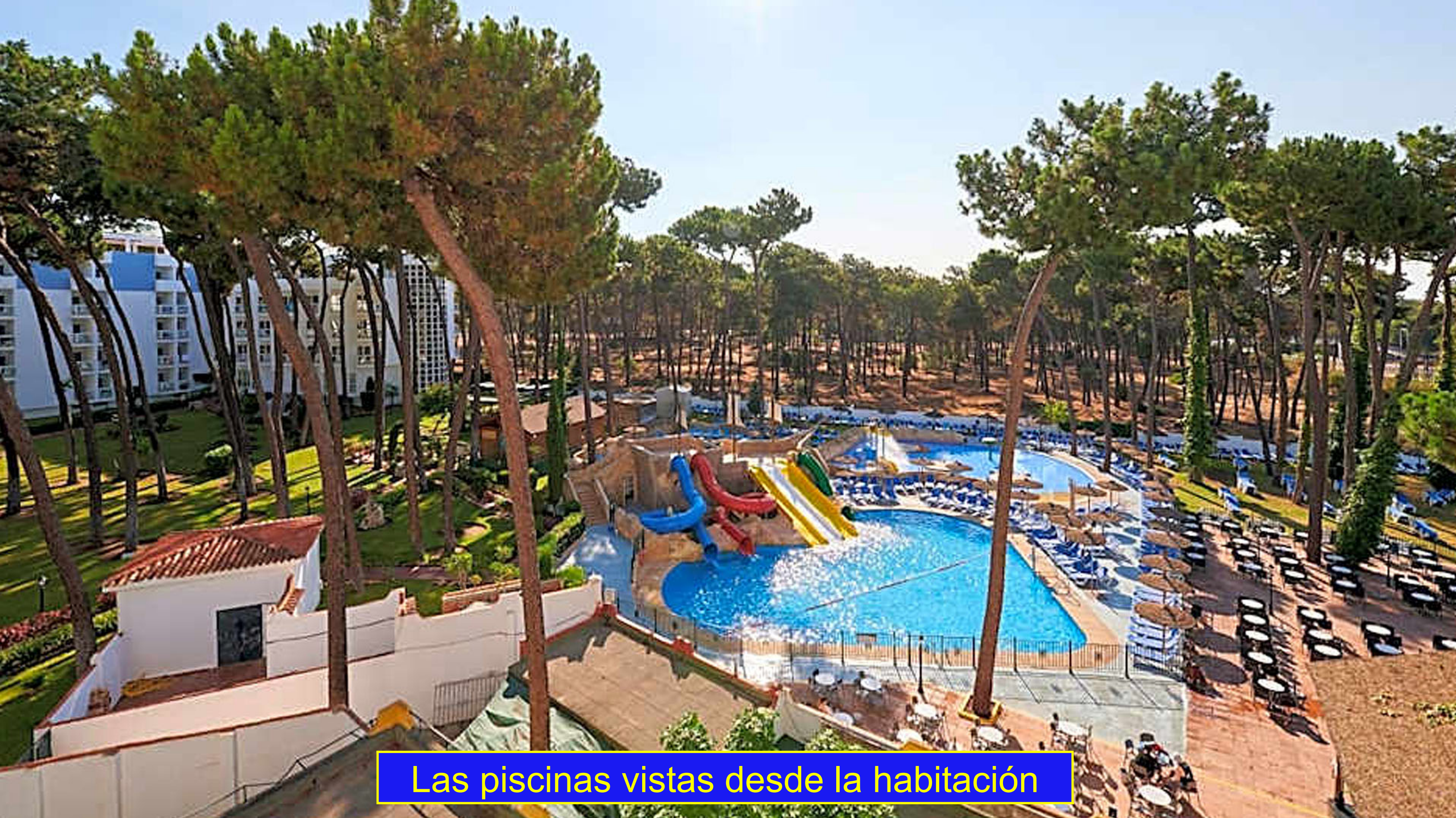
Las piscinas vistas desde la habitación