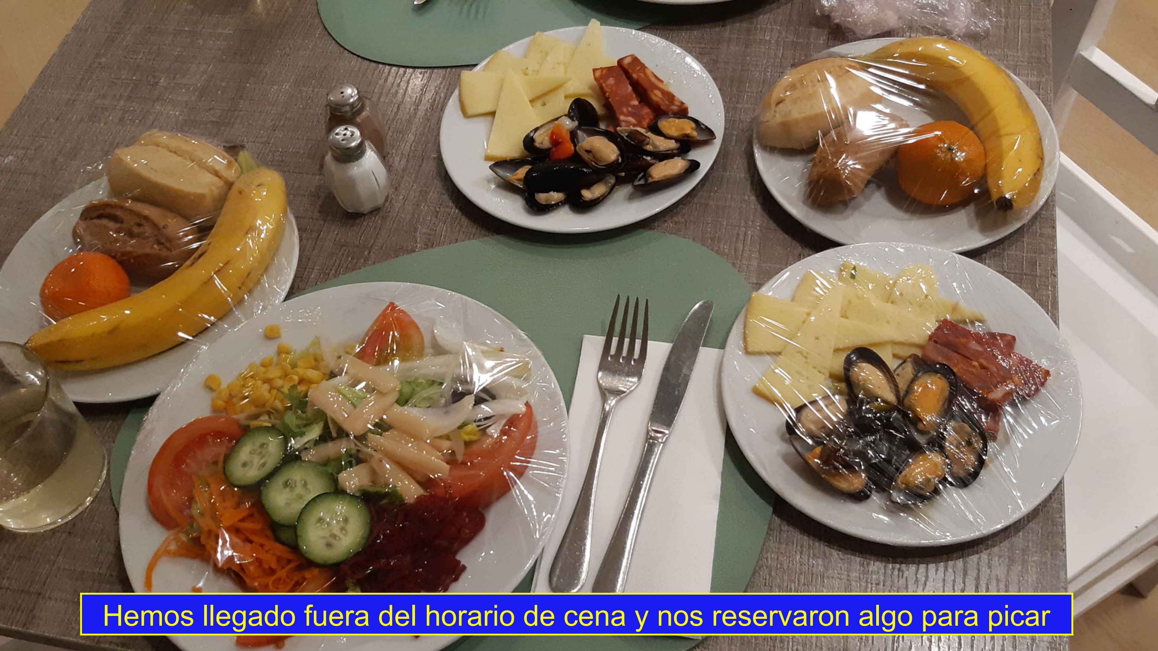
Hemos llegado fuera del horario de cena y nos reservaron algo para picar