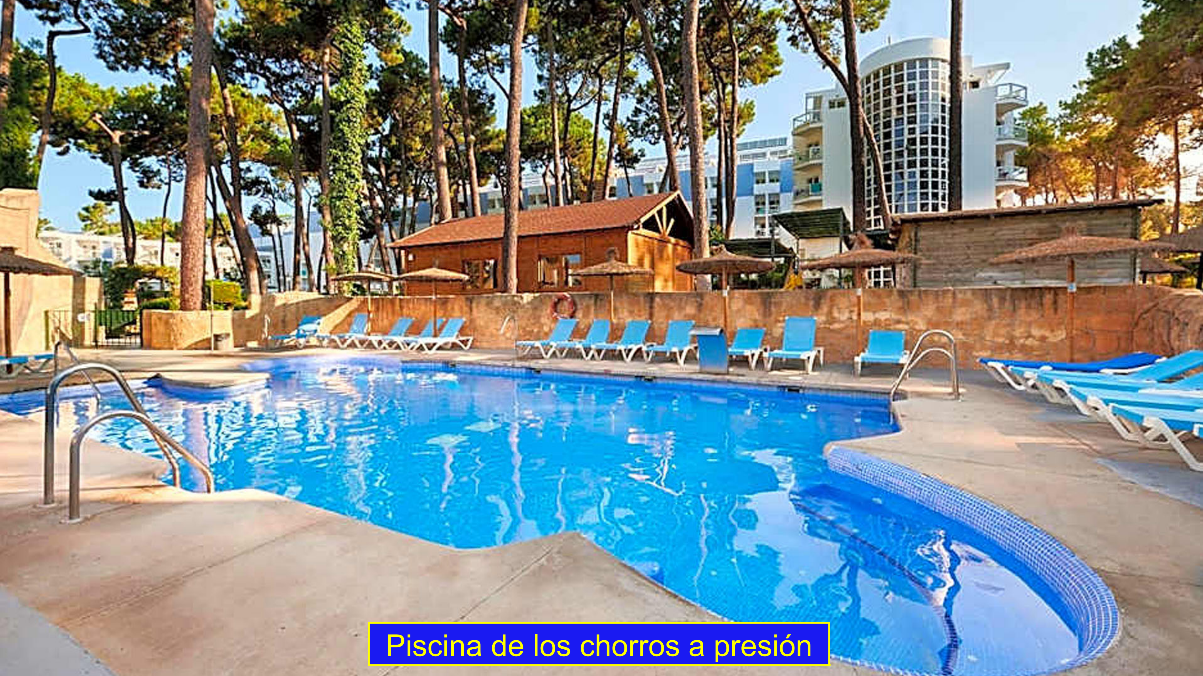
Piscina de los chorros a presión