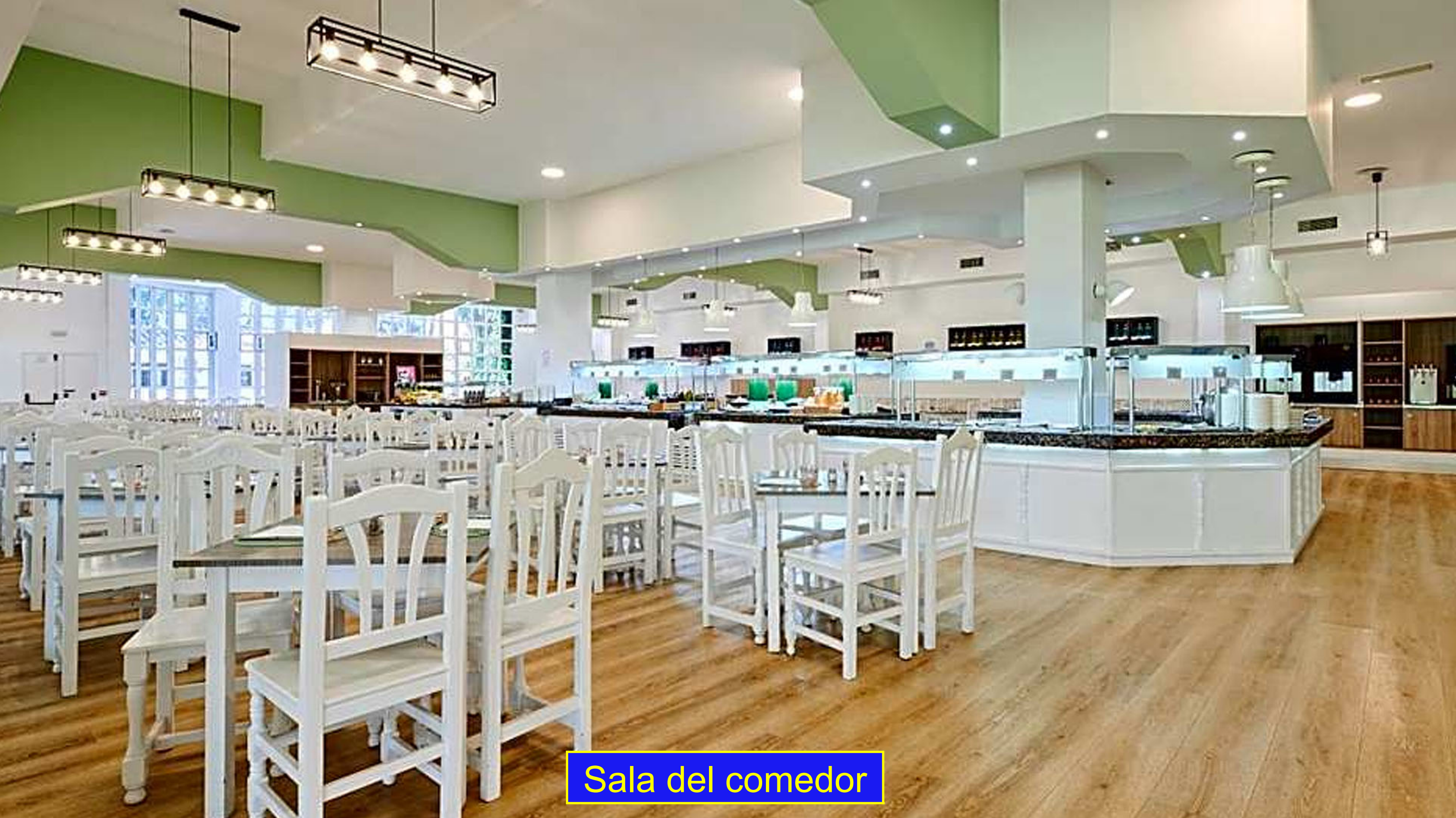
Sala del comedor