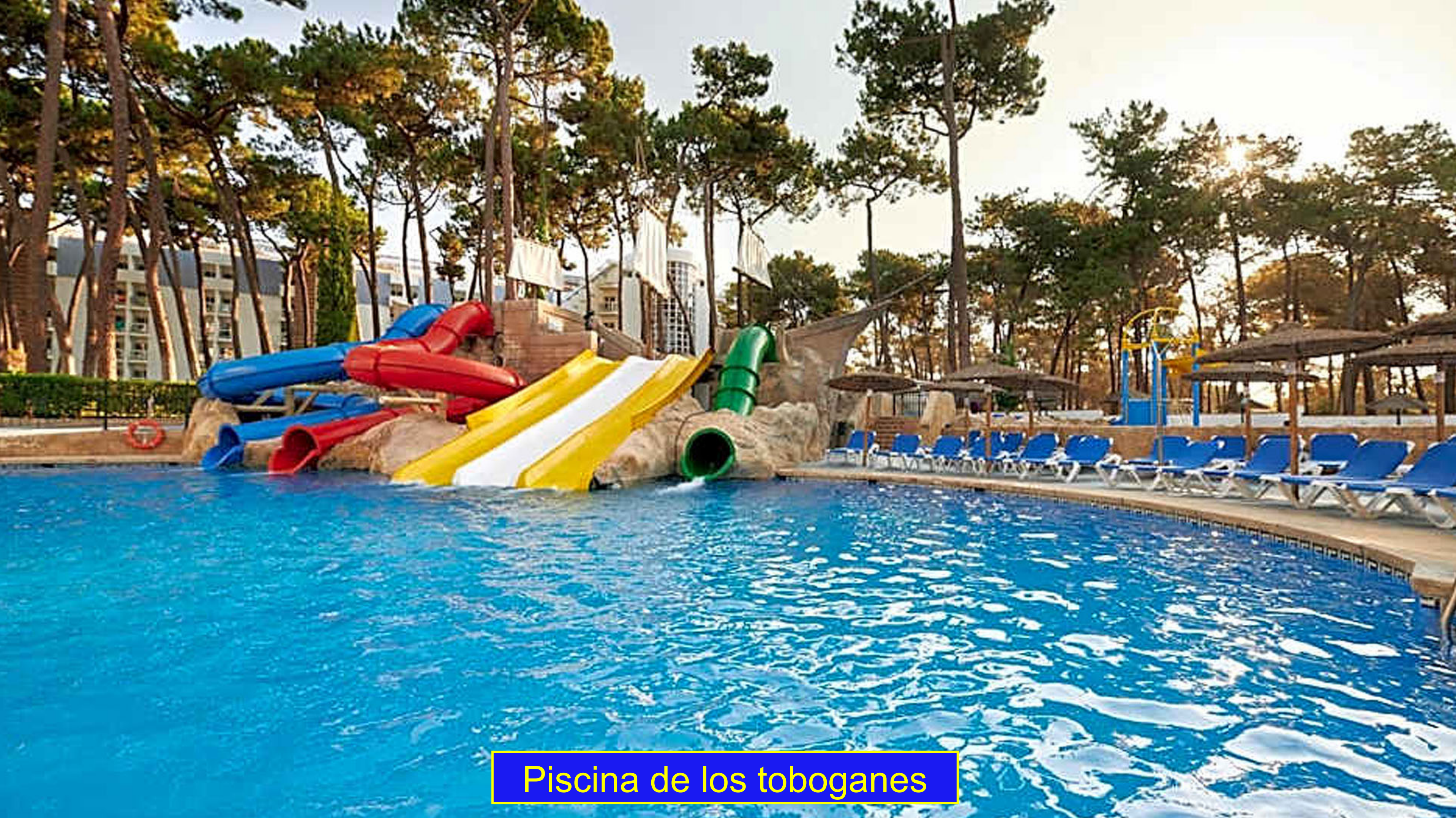
Piscina de los toboganes