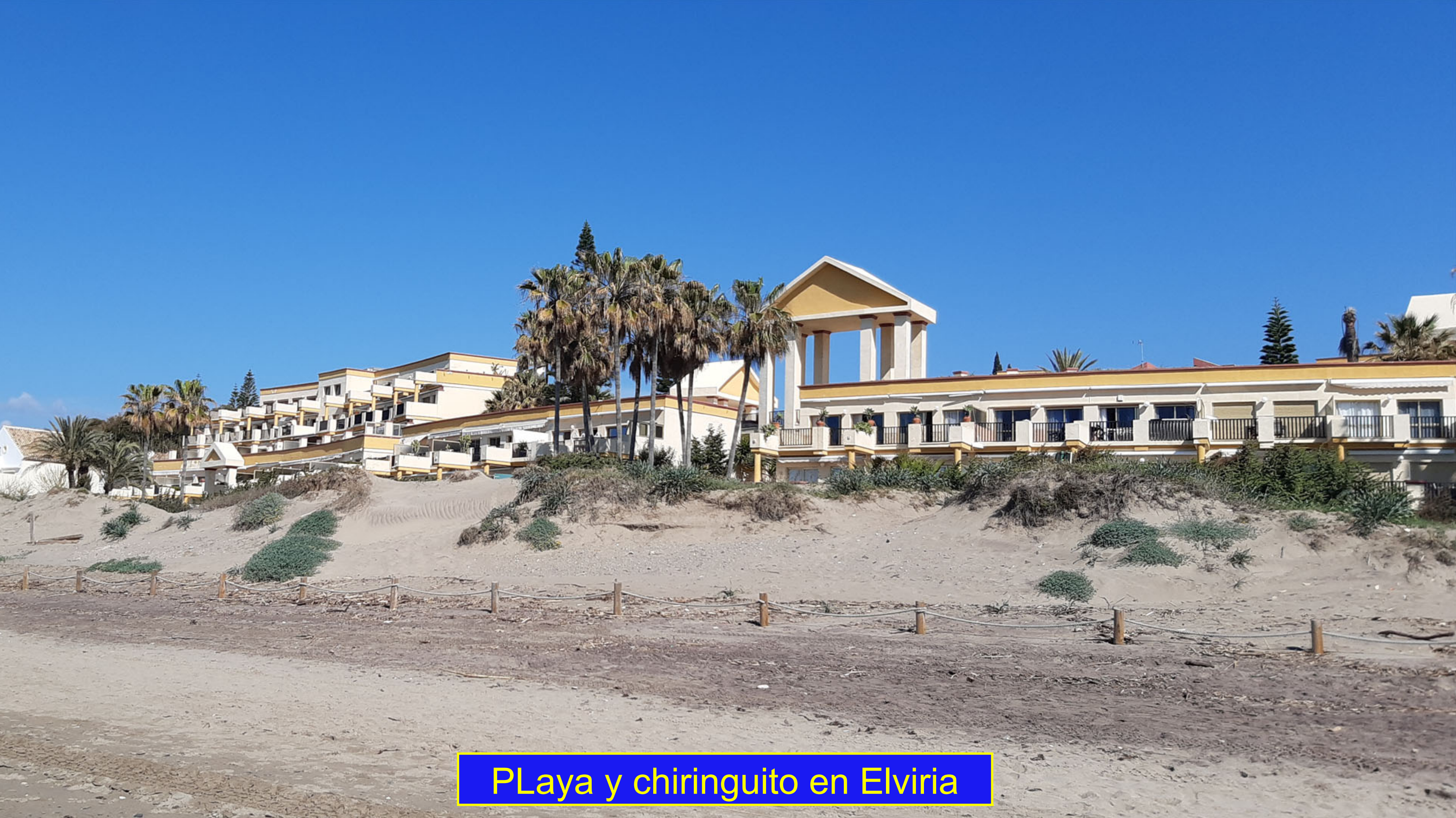
Playa y chiringuito en Elviria