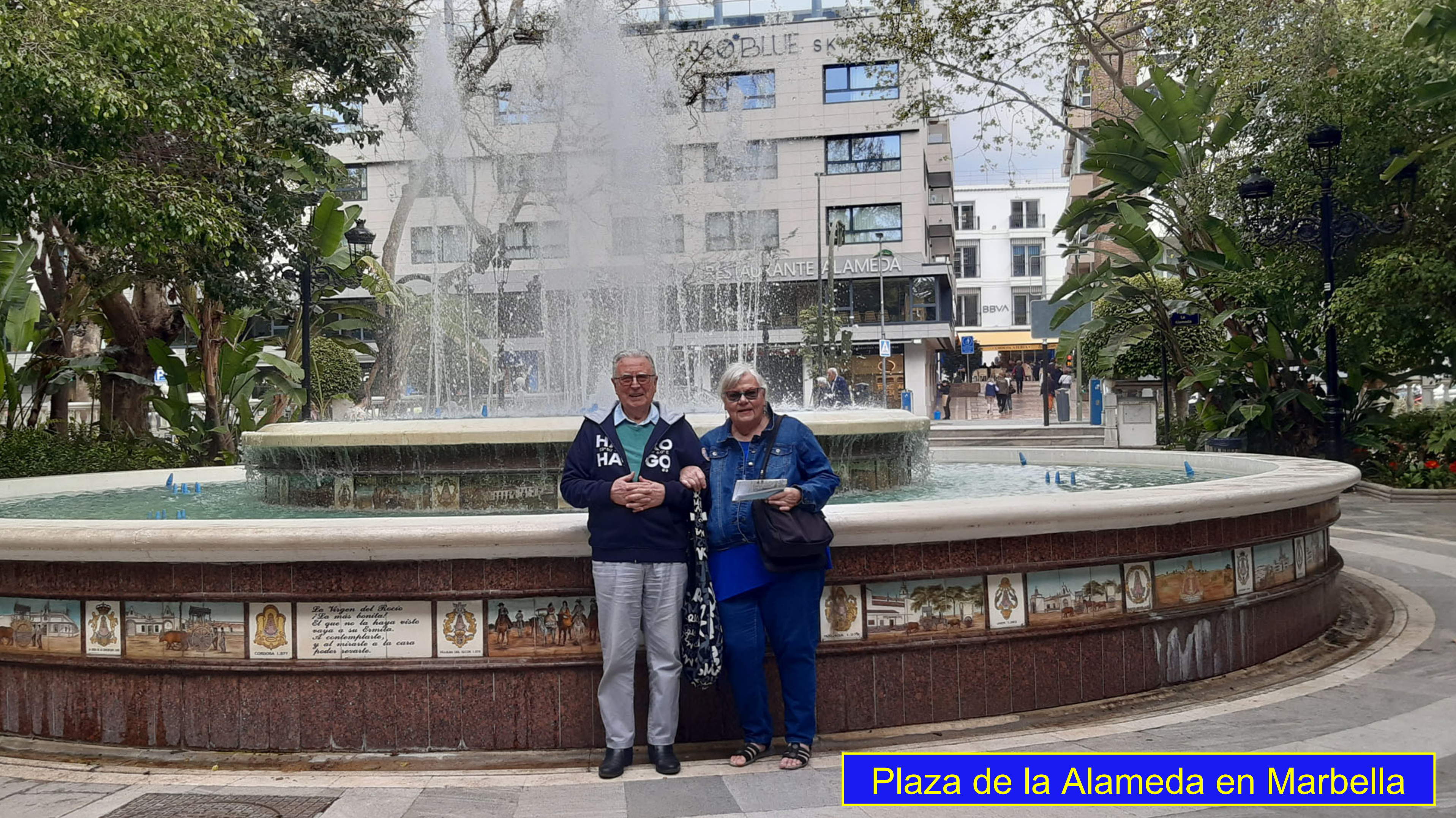
Plaza de la Alameda en Marbella