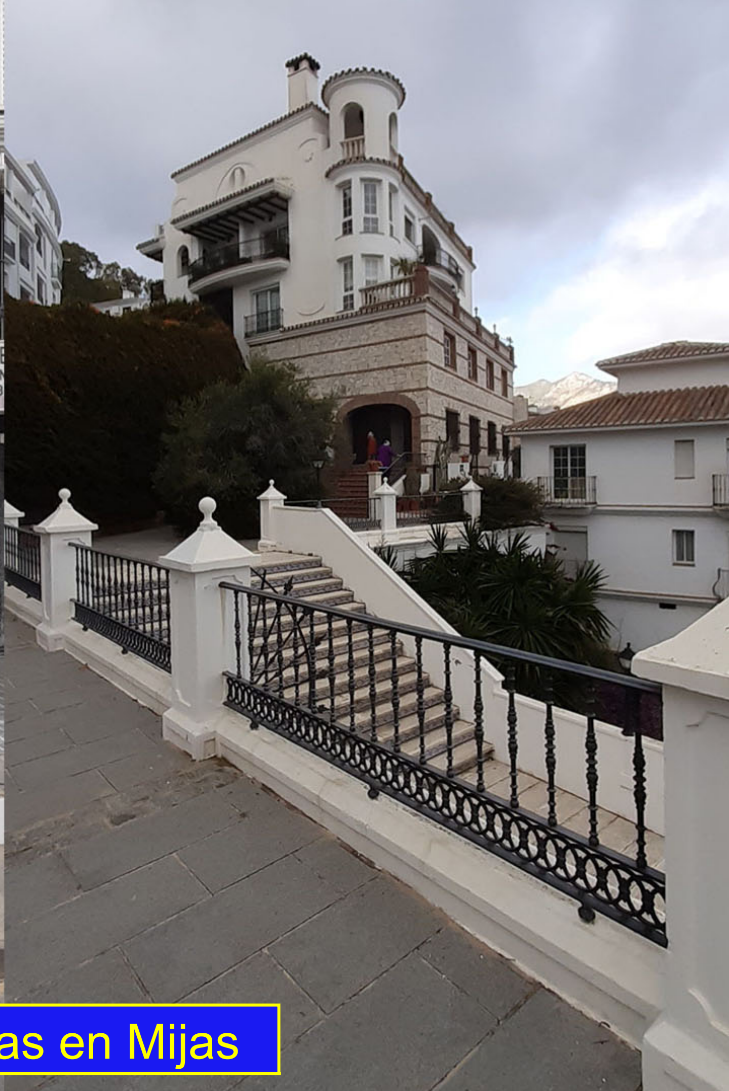
Curiosidades y cuestas pronunciadas en Mijas