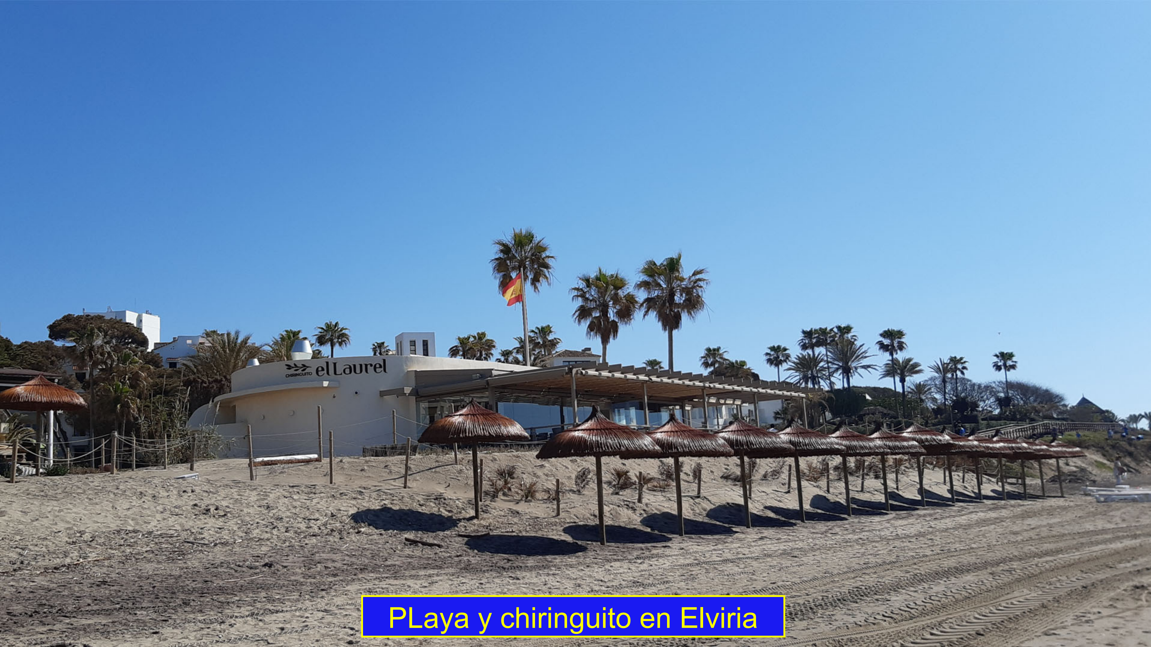
Playa y chiringuito en Elviria