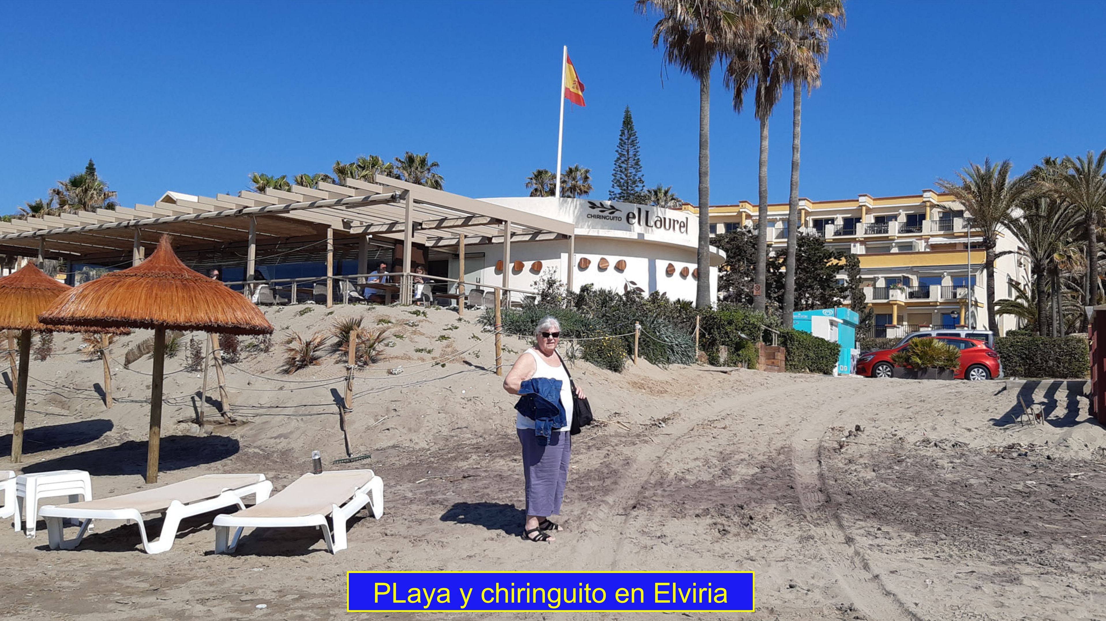
PLaya y chiringuito en Elviria