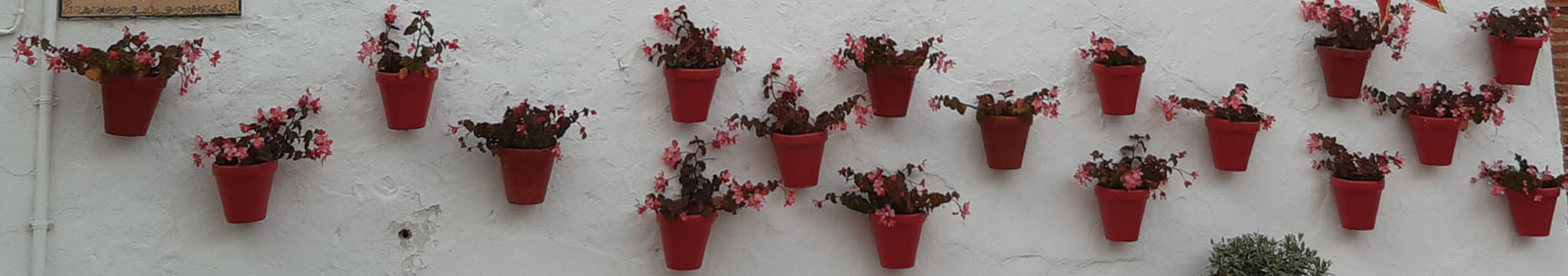
Curiosidades en Marbella