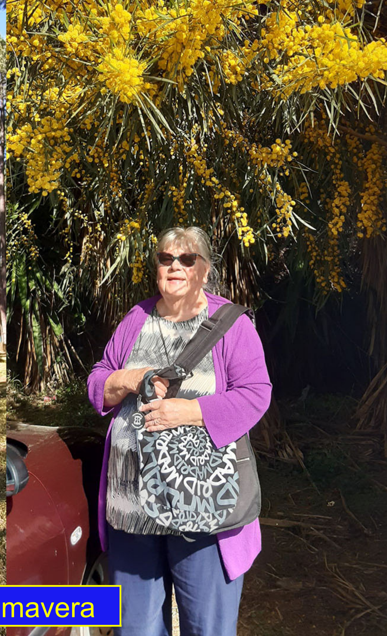
La mimosa florece y alegra la primavera